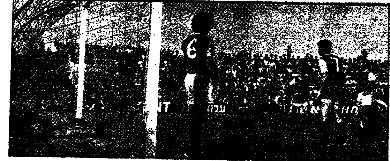
שחקני הפועל חיפה נכנסים למגרש לפני המשחק נגד בית"ר ירושלים.

המשחק הראשון של הליגה הלאומית התקיים ביום שישי (18.10) בין בית"ר ירושלים לבין הפועל חיפה. המשחק הסתיים בתוצאה 1:0 לטובת בית"ר.